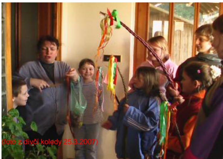
(foto z dívčí koledy 25.3.2007)