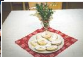
Foto z rozsvěcení vánočního stroměčku